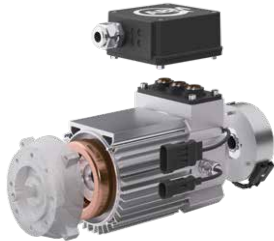
Niedervoltmotoren mit umfangreichem Zubehör